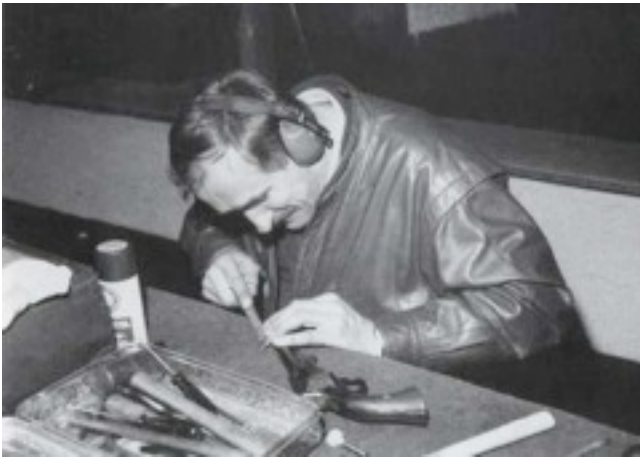
Das Korn muß noch gefeilt werden Vorderladerschützen