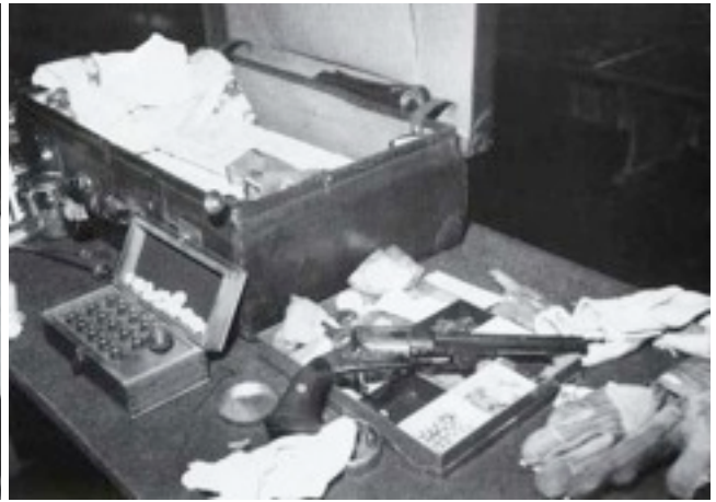
Zubehör für einen