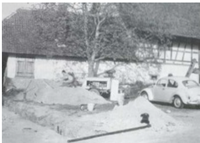
1966 Bau des Wasser- und