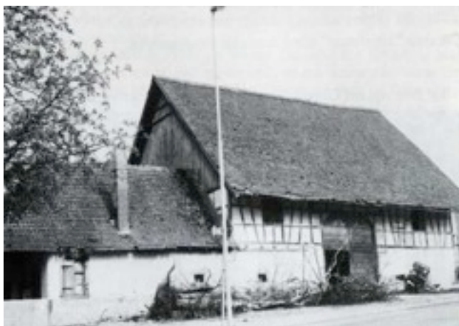
Das alte Schützenhaus 1964 - 1972

Wir wünschen uns, daß die Aufwärtsentwicklung in Zukunft anhält.