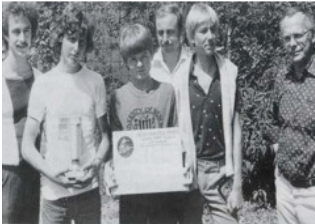
Unsere Jugendmannschaft 1977