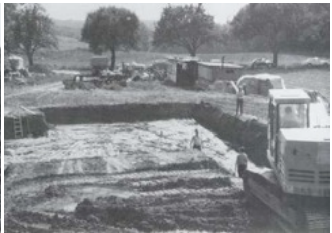
Frühjahr 1973 Baubeginn des Schützenhauses