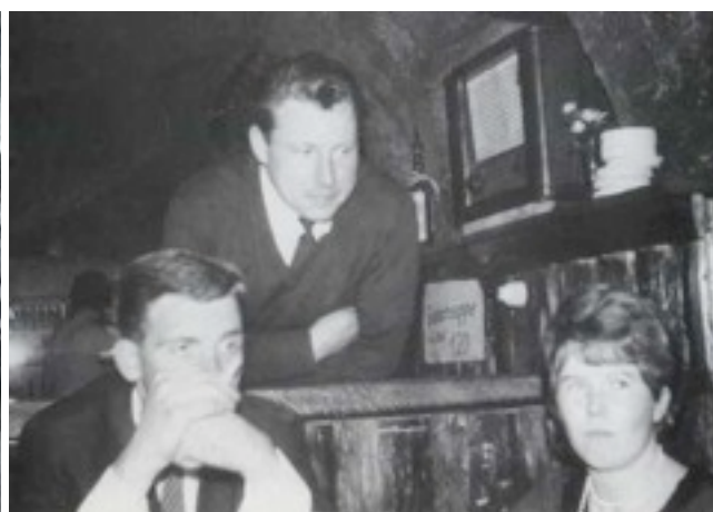
Im alten Schützenkeller 1968