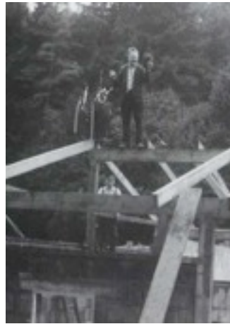
Richtfest des Pistolenstandes