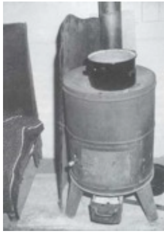
1965 Die Heizungsanlage im alten Schützenhaus