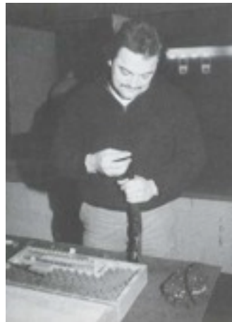
mit viel Liebe beim Laden