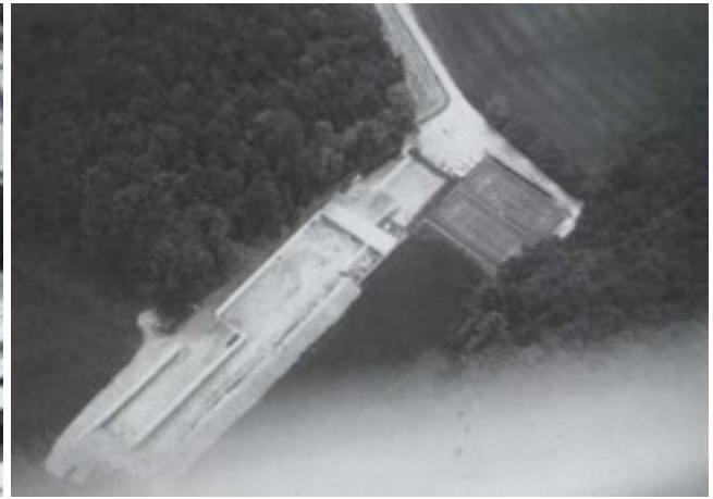
Bau des Gewehrstandes