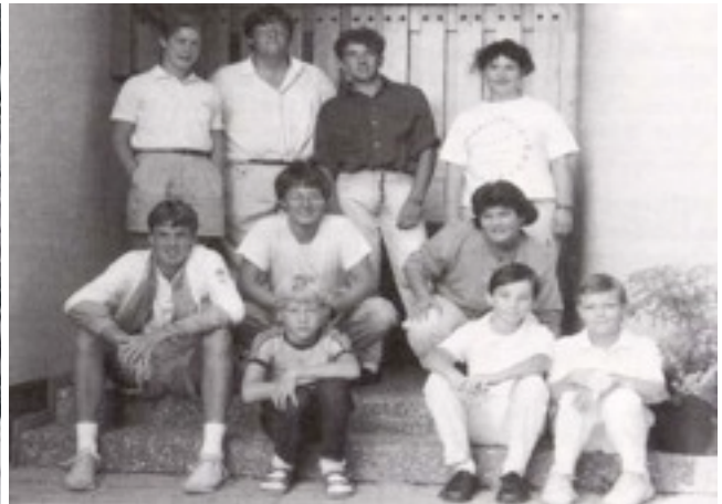
Unsere Jugendmannschaft 1989