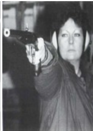
Konzentration vor dem Schuß